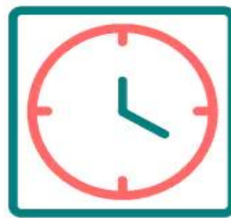
نوع داده تاریخ (Date) و زمان (Time)